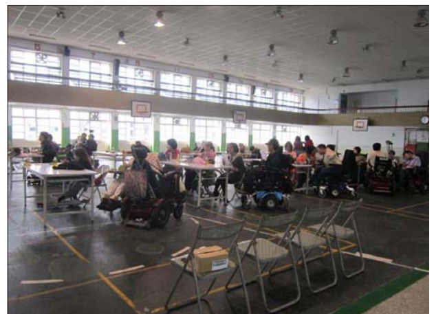
第三屆會員大會(攝影於武功國小)