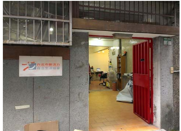
萬隆新辦公室門口照片(未改裝前)