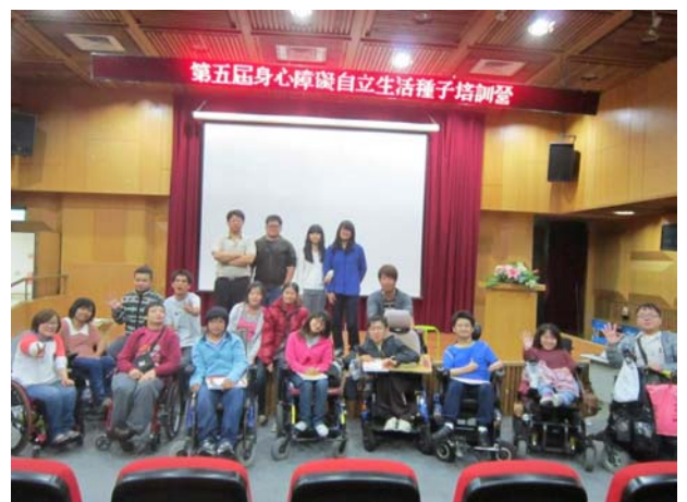
第五屆身心障礙者種子培訓營大合照